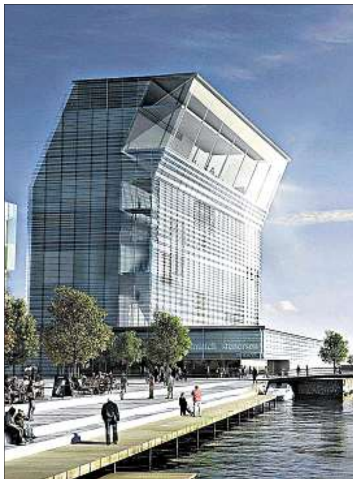
Lambda vil overskygge Operaen, tror artikkelforfatteren.

Som et siste sukk: Munch burde i prinsippet ha et like stort gjestende publikum som Vikingskipmuseet og Vigelandsanlegget. Som for Ikea-bussen, som ikke bare gir gratis tur til salgsstedene, men også smart mobil reklame, burde