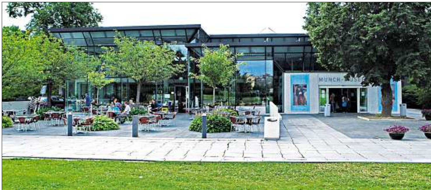
Et nytt bygg på Tøyen vil som arkitektur overgå Lambda, hevder Hvoslef-Eide.

Botanisk Have og Naturhistorisk Museum er perler isolert sett og når en internasjonal legende som Edvard Munch har et så lavt besøkstall, noen jukser riktignok med disse for å promotere Lambda, skyldes dette ikke bare avstanden fra sentrum. Heller ikke bare manglende stimuli under reisen, men også manglende kvaliteter mellom anleggene. Det beste bevis på at et museum er vellykket, er at en god del av de besøkende bare er der uten