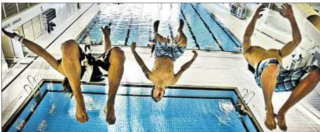
Slike anlegg er det stor mangel på i Oslo. Her trener snowboardlandslaget i svømmehallen på Risenga i Asker.